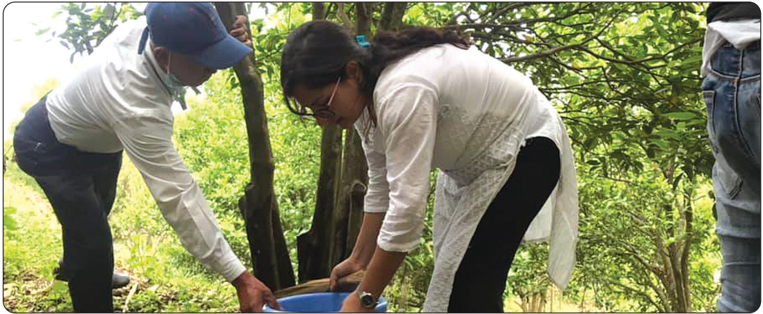
प्रदेश सभा जलश्रोत, कृषि तथा शिक्षा समितिका माननियहरुसंगको अन्तरक्रिया कार्यक्रम